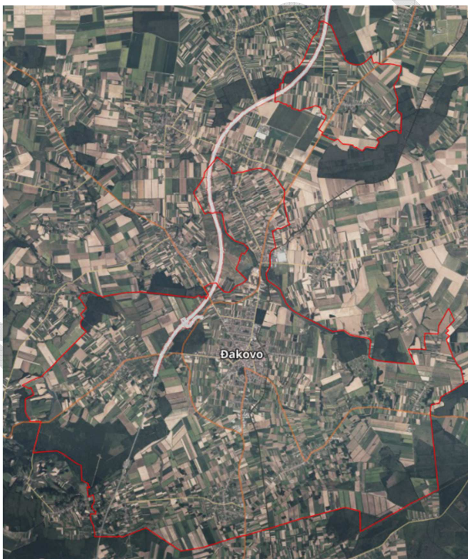
Karta Grada Đakova

Prigradska naselja koja spadaju pod Grad Đakovo su: Široko Polje, Kuševac, Selci Đakovački, Novi Perkovci, Piškorevci, Budrovci, Đurdanci.